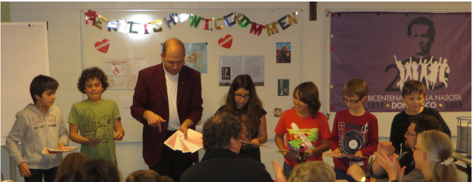
Die Fotos widerspiegeln Teile des fröhlichen Festes.