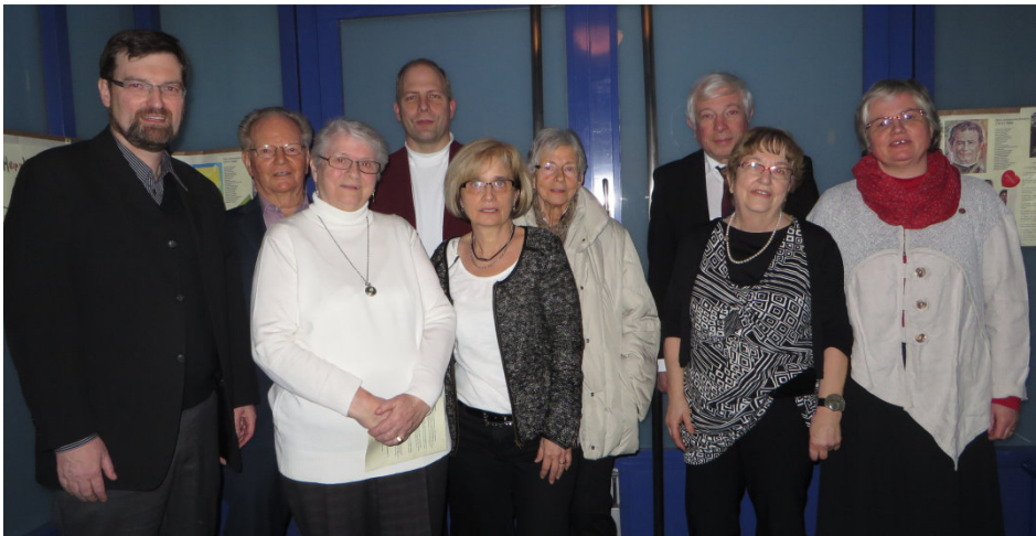
Mitglieder des OZ Beromünster mit den Abgeordneten des Provinzrats